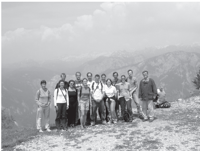
Slika 3: Za slovo skupinska slika na Voglu.