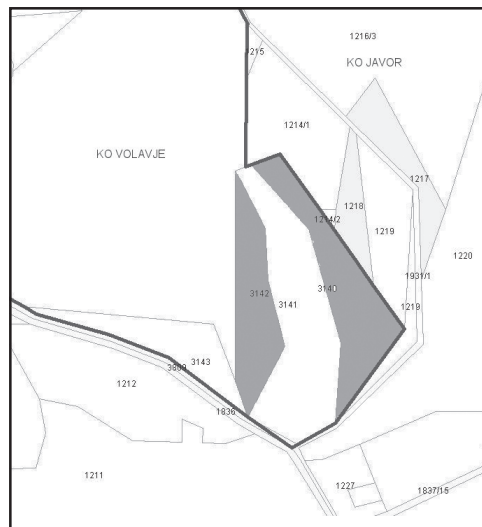
Slika 4: Stanje parcel leta 2005.

Kakšno je stanje danes, leta 2007, ne vem; zadeve nisem več raziskoval. Prikazano pa je stanje v letu 2005 (slika 4), kjer podvojene parcele (če so res), še vedno vodijo v zemljiškem katastru.