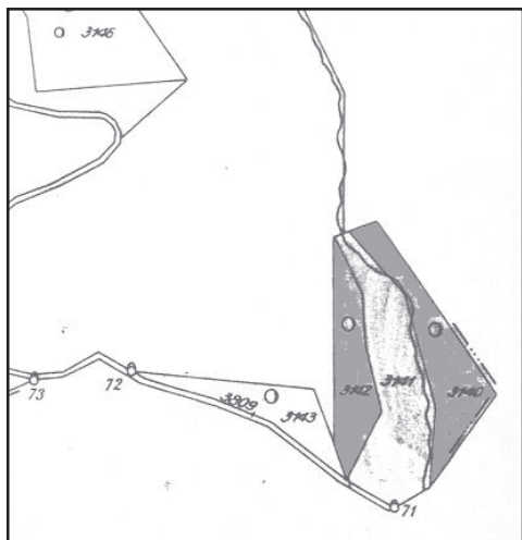
Slika 2: Situacija po reambulaciji leta KO Volavlje,