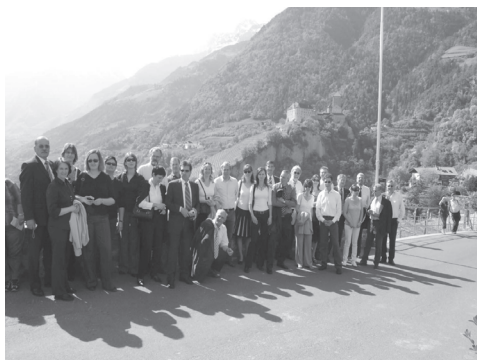
Slika 2: Udeleženci 25. strokovnega srečanja srednjeevropskih geodetskih uprav