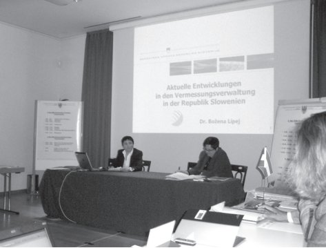
Slika 3: Udeleženke zasedanja.