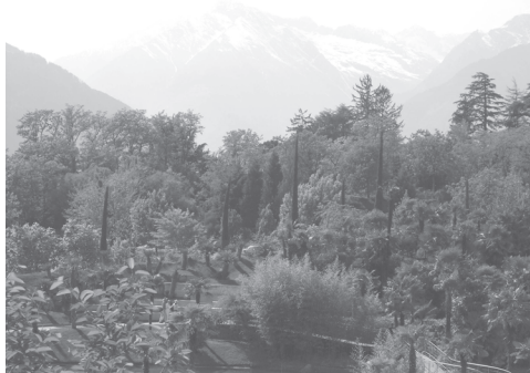
Slika 1: Utrinek z vrta gradu Trauttmansdorff.

Letošnja gostiteljica je bila Italija. V času od 7. do 9. maja nas je gostila v zdraviliškem mestecu Merano, Južna Tirolska in izvedla v vseh pogledih vrhunski dogodek.