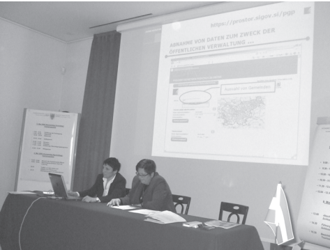
Slika 5: Predstavitev gospodarske javne infrastrukture.

Darja Tibaut je predstavila odmeven projekt evidentiranja gospodarske javne infrastrukture.