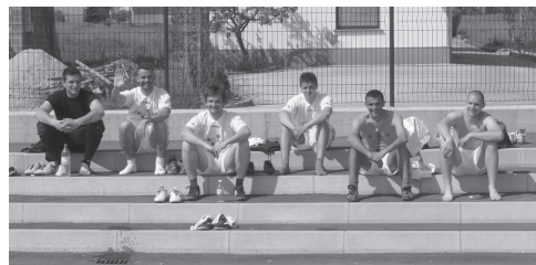
Slika 5: Zmagovalna nogometna ekipa Geograd.

Ob malem nogometu smo organizirali tudi tekmovanje v odbojki.