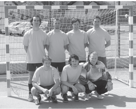
Slika 4: Nogometna ekipa Expro.