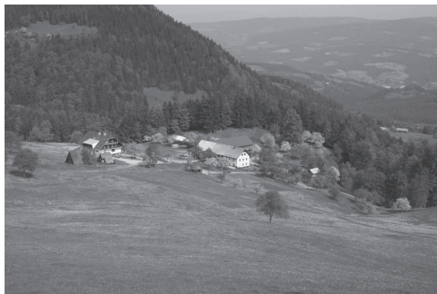
Slika 5: Ošvenova kmetija – zaključek pohoda.

Vračali smo se preko Naravskih ledin in Kozjega hrbta do hribovske kmetije na Ošvenu, kjer je bil pripravljen zaključek s toplim obrokom, pohorsko gibanico, orehovo potico in zlato bistriško kapljico. Za zabavo je poskrbel Koroški duo, ki je dvignil plesno razpoloženje, tako da se je Ošvenova domačija kar tresla.