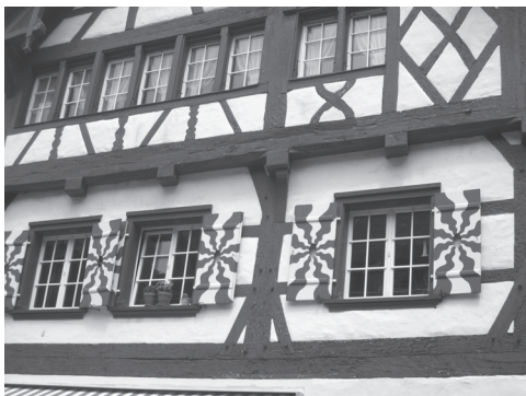
Slika 2: tipične hiše v Stein am Reinu.

Po nočitvi v švicarskem Buksu (znan po fasadah iz lesenih skodel, ki segajo v leto 1715) nas je pot vodila ob Bodenskem jezeru. Najprej smo si na otoku Mainau (Nemčija) ogledali botanični vrt. Naslednji postanek je bil v srednjeveškem mestecu Stein am Rein, katerega zanimivost so slikovite hiše z leseno konstrukcijo in z vmesnimi prostori iz butane gline. Pot smo nadaljevali do Renskih slapov. Po turistični vožnji z ladjico smo sklenili, da zvečer ne potrebujemo tuširanja – s tem so nas nagradili slapovi, saj smo zaupali čolnarju in se jim dovolj približali.