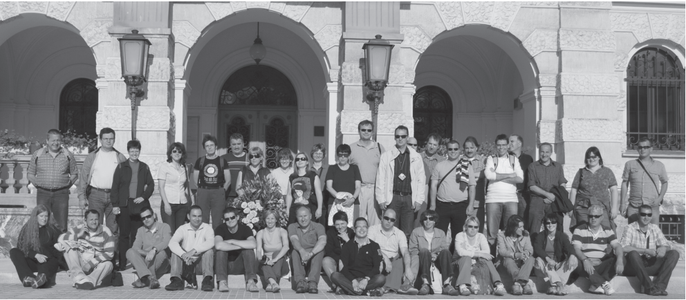
Slika 4: Primorsko geodetsko društvo v Švici.

Saška, ki nas ni spravila na kolena, kljub temu, da smo imeli samo eno zgoščenko glasbe, po izboru šoferja?