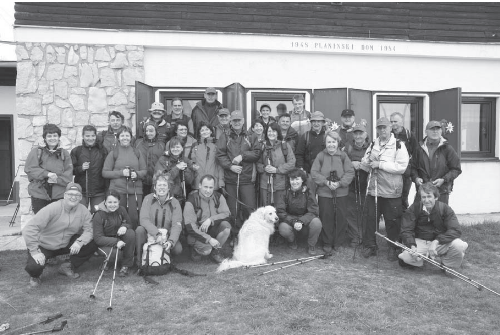
Slika 3: Skupinska slika – Uršlja gora 2008.

Korošci so nam letos organizirali ogled TV-stolpa, kjer smo spoznali delo dežurnih operaterjev in delovanje sprejemanja in oddajanja televizijskih in radijskih signalov.