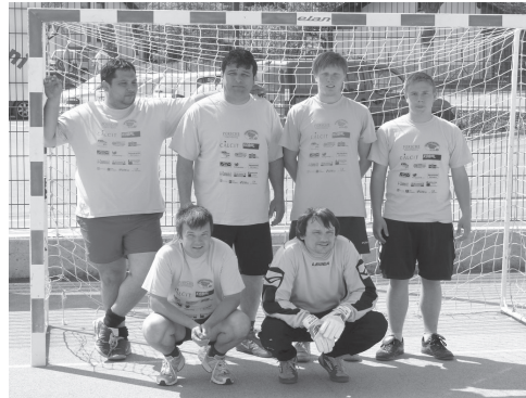
Slika 3: Nogometna ekipa Morostarij.