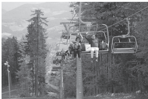
Slika 1: Ob prebujanju dneva doživljamo lepote koroških smučišč.

Zbrali smo se pri Ivarčkem jezeru v Podgori v Kotljah, kjer nas je pričakal planinski zajtrk. Od tam smo se z novo šestsedežnico popeljali do zgornje postaje sedežnice Ošvena. Veselo smo nadaljevali pot po »železarski poti« do vrha Uršlje gore (1696 metrov). Prvi smo kar pohiteli in precej oznojeni osvojili cilj že v dobri uri. Kmalu so se nam pridružili tudi ostali pohodniki in skupaj smo uživali ob pogledu na prelepo Koroško in Saleško dolino. Vreme v hribih je nepredvidljivo in gosta megla nam je za kratek čas onemogočala pogled na ostale koroške vršace.