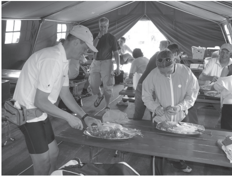
Slika 6: Priprava pojedine v šotoru. Tudi navijači so lahko koristni ...