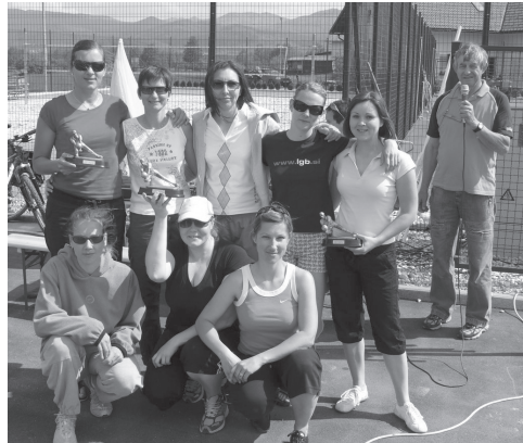
Slika 7: Odbojkarke pri podelitvi: LGD I, LGD II in Ljubljanski geodetski biro.