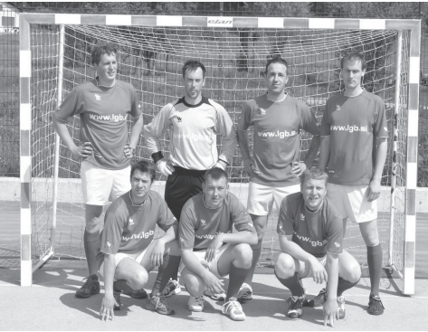
Slika 2: Nogometna ekipa Ljubljanskega geodetskega biroja.