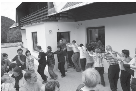
Slika 6: Prijetno razpoloženje, ki nas je družilo prek celega dne.