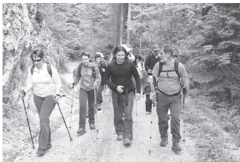
Slika 2: Dobra volja in strumen korak je naš prepoznavni znak.