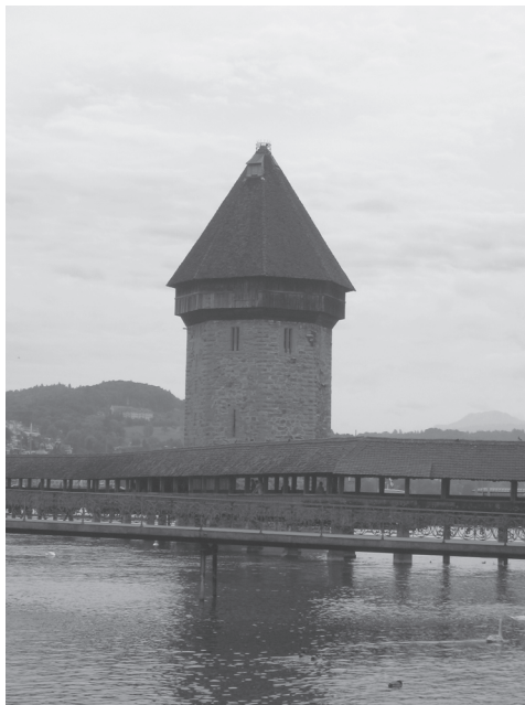
Slika 2: Kapelski most v Luzernu.