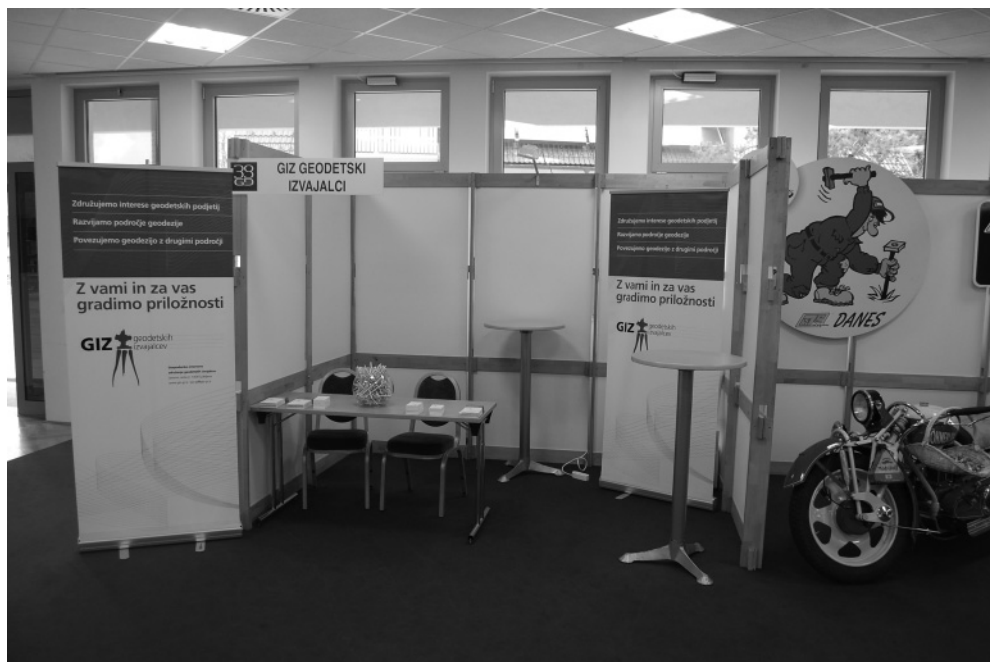
Slika: Razstavní prostor GIZ GI na Geodetskem dnevu

Danes GIZ GI združuje 89 podjetij, ki se ukvarjajo z geodetsko dejavnostjo in predstavljajo približno 70 % zaposlenih geodetov v zasebnem sektorju. Vizija združenja je vsem članom zagotavljati razmere za uspešno poslovanje na področju geodezije in sorodnih delovnih področjih. Osnovno načelo še vedno ostaja povezovanje geodetskih podjetij za lažje doseganje skupnih ciljev, ki med gospodarsko krizo postajajo še pomembnejši.