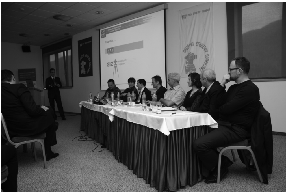
Slika: Okrogla miza na Geodetskem dnevu

Na Geodetskem dnevu, ki je aprila potekal v Kranjski Gori, smo se kot soorganizatorji predstavili z razstavnim prostorom in pripravo okrogle mize z naslovom »Od geodetskih storitev k storitvam geodeta«, ki smo jo organizirali skupaj z Matično sekcijo geodetov pri IZS.