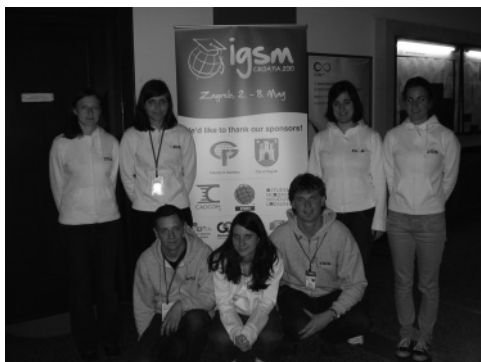
Slika 1: Slovenski predstavniki

Že triindvajsetič zapovrstjo je potekalo srečanje International Geodetic Student Meeting, krajše IGSM, ki ga organizira IGSO (International Geodetic Student Organization, Mednarodna organizacija študentov geodezije). Letošnji organizatorji so bili naši južni sosede, srečanje pa je potekalo od nedelje, 2. maja 2010, do sobote, 8. maja 2010. Za začetek naj najprej opiševa potek dogajanja. Letos so nas torej gostili Hrvati, in sicer Geodetska fakulteta v Zagrebu. Med šestnajstimi državami se je s sedmimi predstavniki Fakultete za gradbeništvo in geodezijo Univerze v Ljubljani študentskega srečanja prihodnjih geodetov udeležila tudi Slovenija.