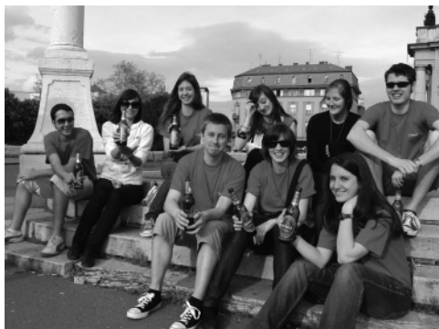
Slika 6: Po napornem ogledu Zagreba smo si z Angleži in Avstralci privoščili laško pivo.