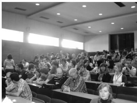
Slika 2: Polna predavalnica udeležencev iz šestnajstih držav