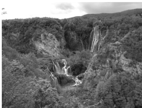
Slika 5: Narava Plitvičkih jezer