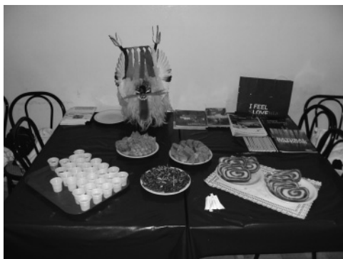
Slika 8: Obložena slovenska miza

A nismo le poslušali predavanj, temveč smo bili deležni tudi presenečenj. Ogleдали smo si doslej neznano vasico Krapje, ki pripada narodnemu parku Lonjsko polje, in si privoščili celodnevni izlet po Plitvičkih jezerih. Pri ogledu znamenitosti Zagreba so gostitelji uporabili »Geo Challenge«, ki spominja na orientacijski tek oziroma hojo. Hrana je bila zelo podobna naši, letos pa so ponovno uvedli »National Evening« oziroma narodni večer, kjer je vsaka država predstavila svoje dobrate. Pri slovenski mizi so občudovali kurentovo masko, domačo orehovo potico, kruh in salamo ... Študentje so najbolj pohvalili borovničev liker, zaostajala pa ni niti medica, saj sta obe pijači kar hitro pošli. Za pravo študentsko ozračje so poskrbeli z nočnimi zabavami, ki so nas pošteno zdelale in zazibale v spanec.