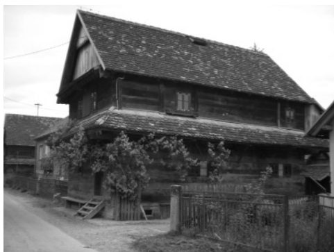
Slika 4: Zanimiva je bila tudi arhitektura na Lonjskem polju.