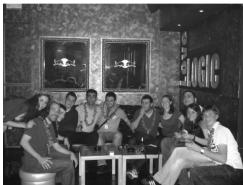
Slika 9: Slovenci v družbi Turkov, Srbov, Hrvatov ...

Med študenti geodezije z vsega sveta so se spletle trdne vezi in dokaz tega je pobuda srbskih študentov za organizacijo srečanja študentov iz naše pretekle skupne države. Slovenci in Hrvatje smo pobudo sprejeli odprtih rok in se s kolegi iz Beograda dogovorili, da bomo s skupnimi močmi pripravili prvo poskusno srečanje že to jesen. Uresničitev zamisli bo zahtevna, a srbski kolegi razmišljajo, da bi se že prvi konec tedna letošnjega novembra srečali v Beogradu.