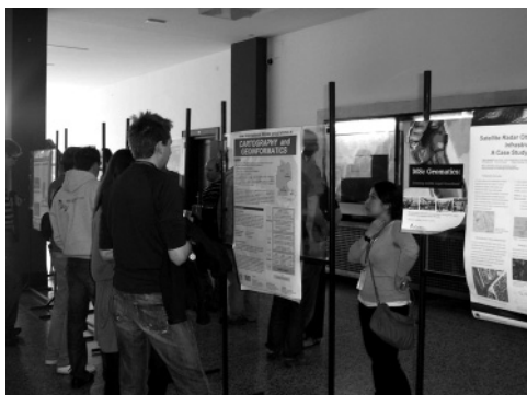
Slika 3: »Poster session«