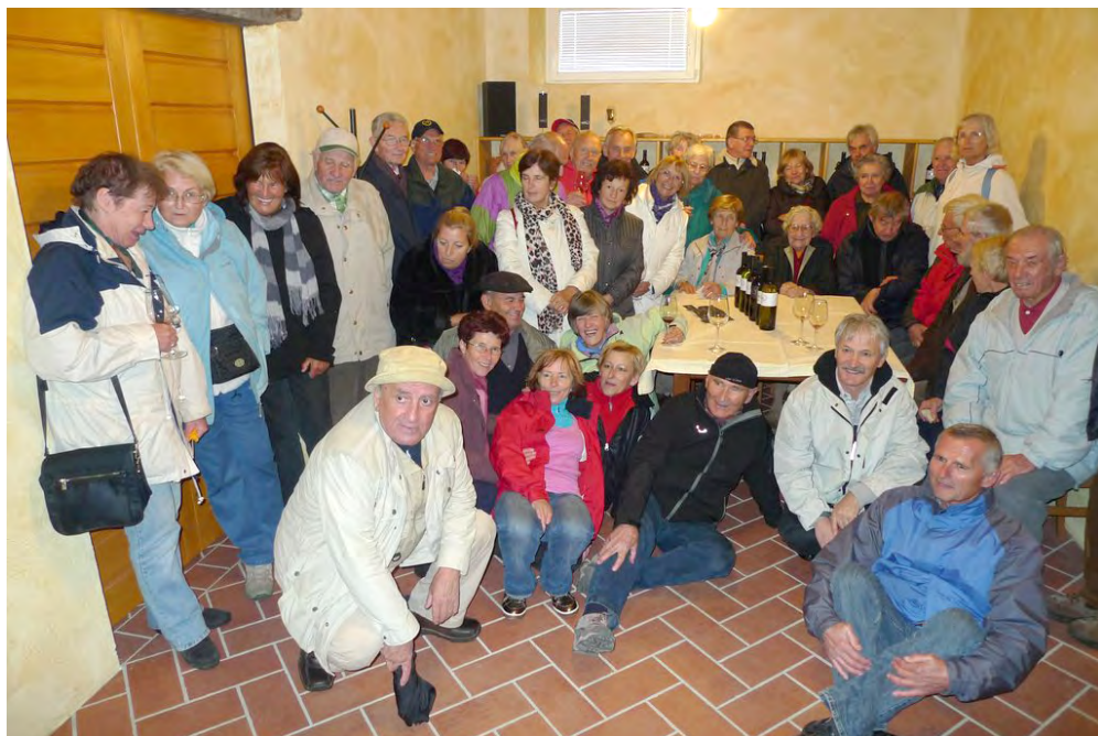
Slika 5: Skupinska slika za spomin na prijazen sprejem in odlična vina v kleti Miška