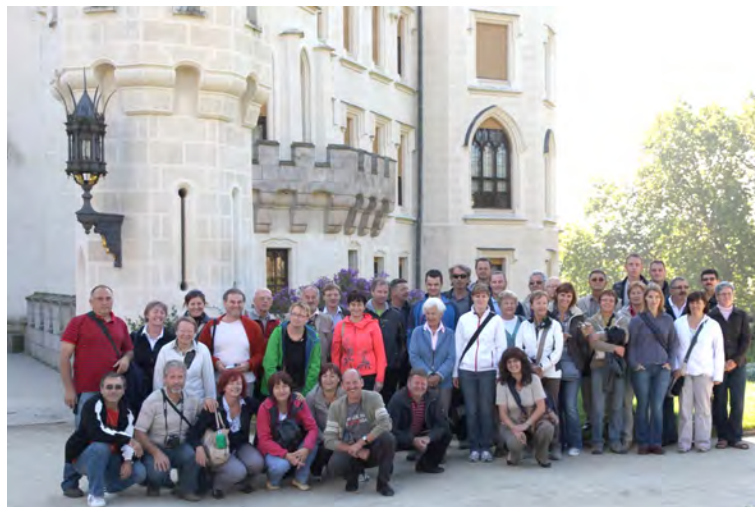
Slika 5: CGDjevci pred gradom Hluboka

Naslednji dan smo si ogledali dva znamenita češka gradova. Prvi se je v meglenem jutru skrival Hlubuka – najbolj znan grad na Češkem, zgrajen na skali nad mestecem Podhradi. V pisnih virih je omenjen že leta 1285. Zasnovan je podobno kot windsorski – v obliki podaljšanega pravokotnika z dvema dvoriščema in več kot desetimi stolpi. V obliki, kot ga vidimo danes, je bil dograjen leta 1863. Današnjim obiskovalcem s svojo veličastno zunanjo podobo in izredno lepimi sobanami kaže na tri stoletja trajajočo slavno dobo Schwarzenberkov – gospodov s Hluboke.