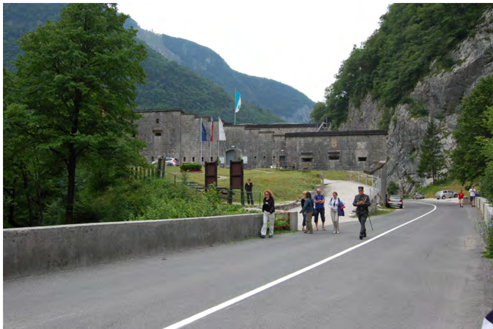
Slika 1: Trdnjava Kluže

Sedemnajstega junija smo se odpravili na enodnevni izlet po poteh Soške fronte in v Goriška brda. Z avtobusom smo se odpeljali od Kranja proti Kranjski Gori, Trbižu, Predilu, do Loga pod Mangartom in naprej po dolini Soče. Naša prva postaja je bila trdnjava Kluže.