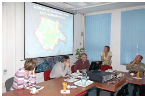
Slika 3: Na katastrskem uradu

Češki kolegi so nas kljub pozni popoldanski uri prijazno sprejeli in nam pripravili kratko predavanje v angleškem jeziku o organiziranosti češkega katastra.