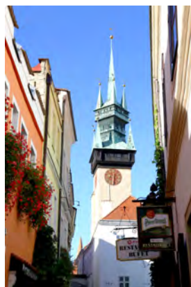
Slika 2: Znojmo

Popoldne istega dne smo se na poti do Čeških Budejovic ustavili v vintoci, kjer smo poskusili mlado vino ali »burčak«. Bela vina, ki nam jih je v pokušino ponudil mlad češki vinogradnik, so se nam (od slovenskih dobrih vin razvajenim popotnikom) zdela zanimiva. Rdeče vino pa