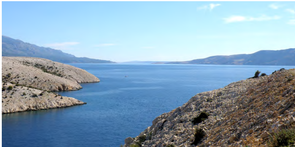
Slika 2: Bilo je lepo

V mestu Krk smo se vkrcali na ladjico. Odpluli smo proti Golemu otoku, uživali v prekrasnem vremenu, ob vinu in ribah, ki so nam jih pripravili na ladji, in se ob dalmatinski glasbi prepustili plovbi. Ozračje je bilo enkratno, lesketajoče morje, galebi, ki so nas obletavali, in pogledi na čudovite zalive so nas napolnili z energijo.