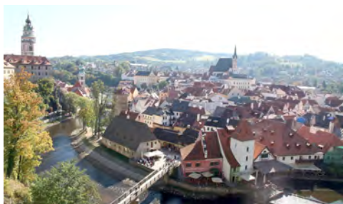
Slika 8: Češky Krumlov

Prehitro je prišel zadnji dan izleta, ki smo ga začeli z obiskom čudovitega svetovno znanega mesteca Češky Krumlov. Razkropili smo se po ozkih ulicah in umetniških trgovinicah za lepo vzdrževanimi starimi pročelji, opravili še zadnje nakupe ali pa si, v eni izmed mnogih kavarnic, privoščili kavo ob pogledu na vrvež množice turistov. Pot proti domu smo prekinili s postankom za ogled gradu Rožnberk, ki se z lepim renesančnim okrasjem na pročelju mogočno bohota na vzpetini nad Vltavo.