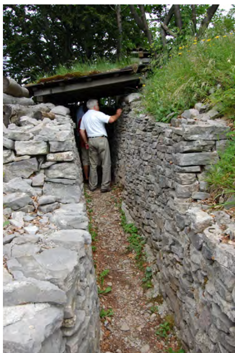
Slika 6: Sprehod po rovih in jarkih