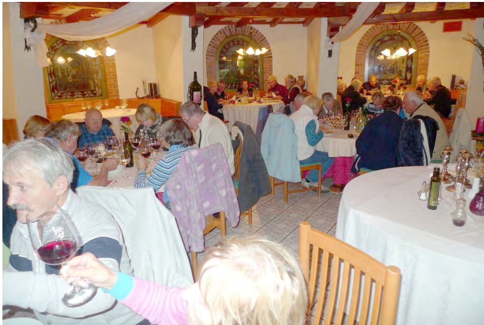
Slika 6: V Vipavskem hramu

Po tako bogatem dnevu smo si nedvomno zaslužili topel obrok. Zavili smo v Vipavski hram, kjer so nam takoj postregli z vročo juho, ki se je zelo prilegla, in seveda tudi z okusnim nadaljevanjem. Ko smo pa dobili krožnik s sladico – violino, narisano s čokolado, in izvrstno tortico –, se mi je utrnila misel, da je življenje kot violina, ki pa nam danes posebno lepo igra.