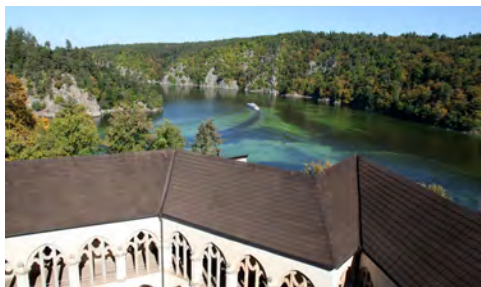
Slika 6: Pogled z gradu Zvikov na Vltavo

Okušanje piva smo CGDjevci ob in po večerji nadaljevali v mestni pivnici Masne Kramy. Za pod zob tudi tokrat ni manjkala klasična svetovno znana jed iz češke kuhinje – kruhovi cmoki oziroma »houskove knedliky«.