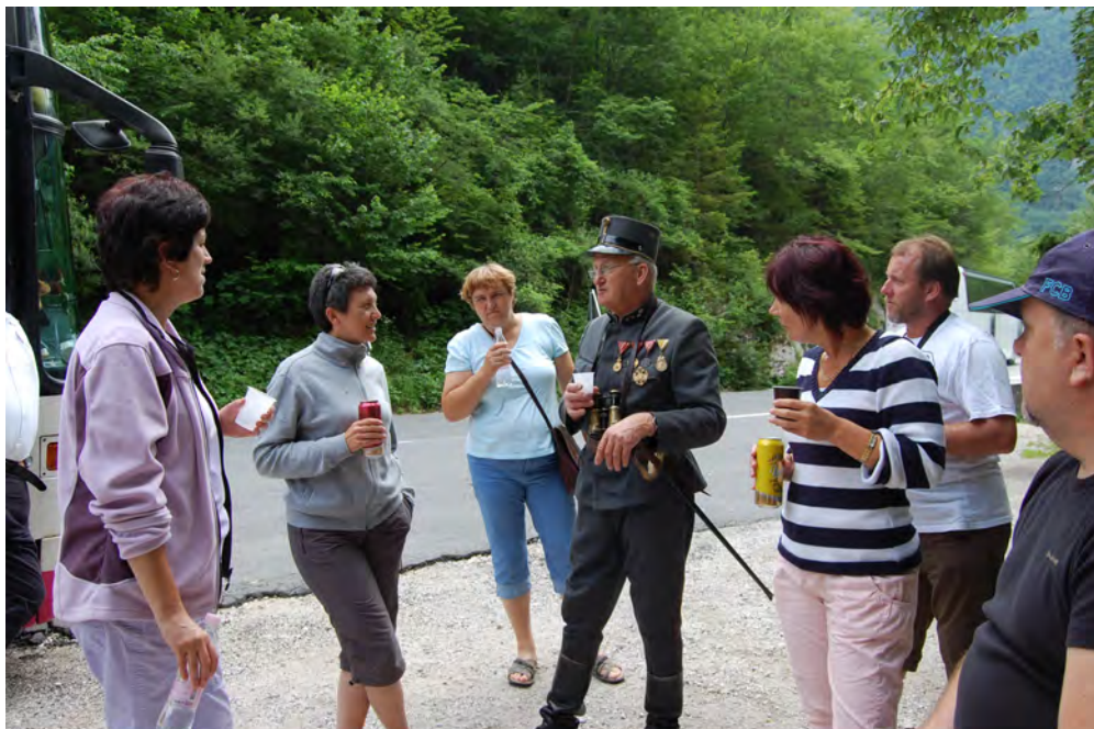
Slika 3: Ofcir je z veseljem nazdravil z nami