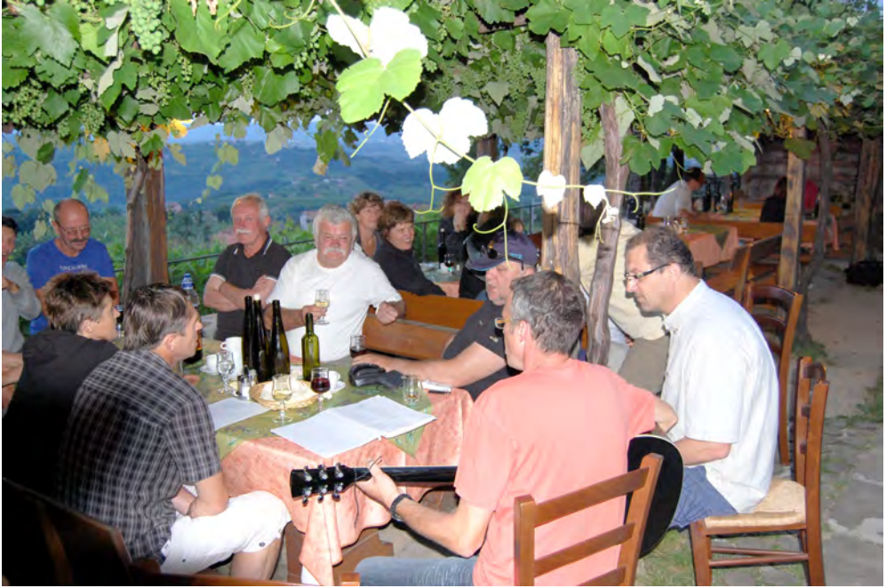
Slika 7: Z nami je bil tudi kitarist

Polni vtisov smo se odpravili naprej po dolini v Goriška brda. Ustavili smo se pri razglednem stolpu, ki je osrednja točka Goriških brd.