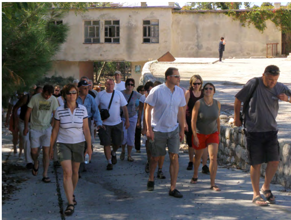
Slika 3: Ogled Golega otoka