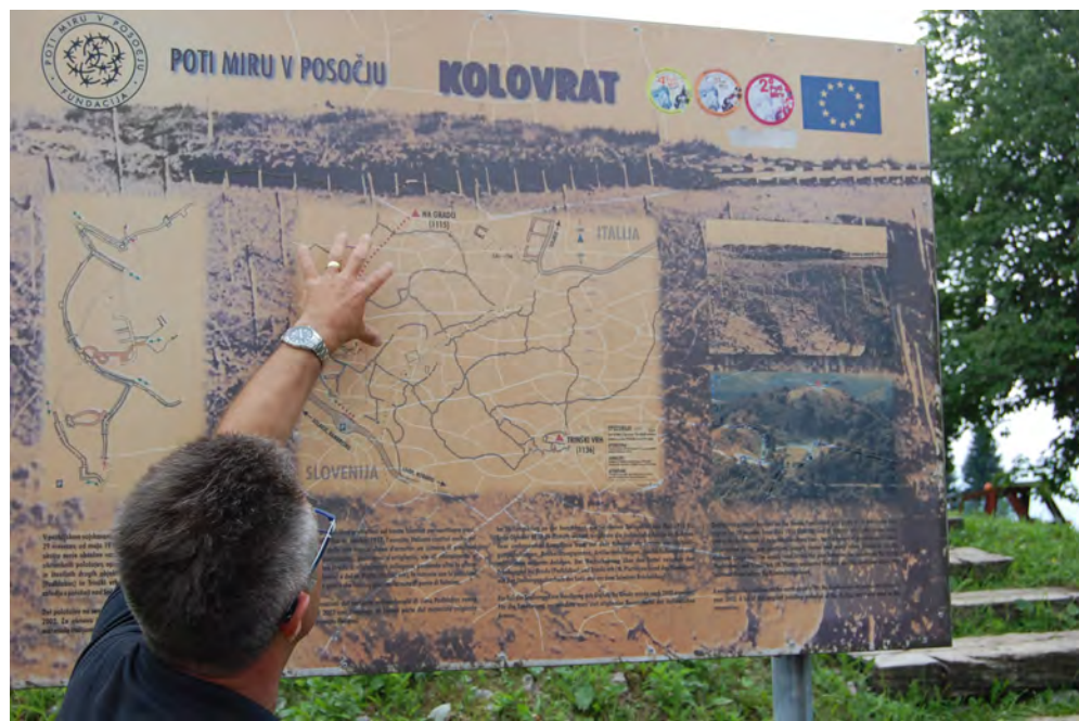
Slika 4 : Razlaga strica Toneta

Odpravili smo se na Kolovrat – greben Kolovrata je prehodno območje med zgornjim Posočjem na slovenski strani in Benečijo na italijanski strani, na njem je urejen muzej na prostem. Od tod se odpira lep razgled na nekdanje bojišče od Krnskega pogorja do Svete gore in Furlanske nižine. Tu so poveljniška in opazovalna mesta, mitraljezni in topniški položaji ter mreže strelskih in povezovalnih jarkov. Objekti tvorijo sistem tretje obrambne črte, ki so ga med prvo svetovno vojno zgradili Italijani. Ob poznavalski razlagi strica Toneta zvedeli veliko novega in zanimivega.