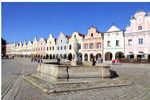
Slika 1: Telč

Glavna znamenitost Telča je mestni trg s čudovitimi gotskimi pročelji, ki tesno zapirajo zelo lep in prostoren trg. Staro mestno jedro je na Unescovem seznamu svetovne kulturne dediščine in je vsekakor vredno ogleda.