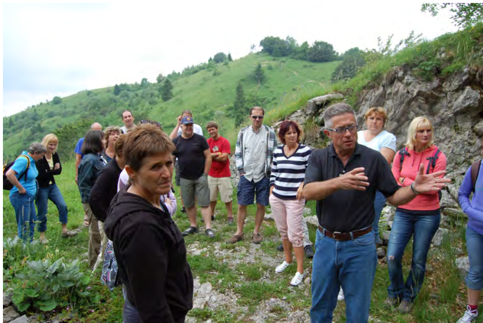
Slika 5: Postanek pred rovi