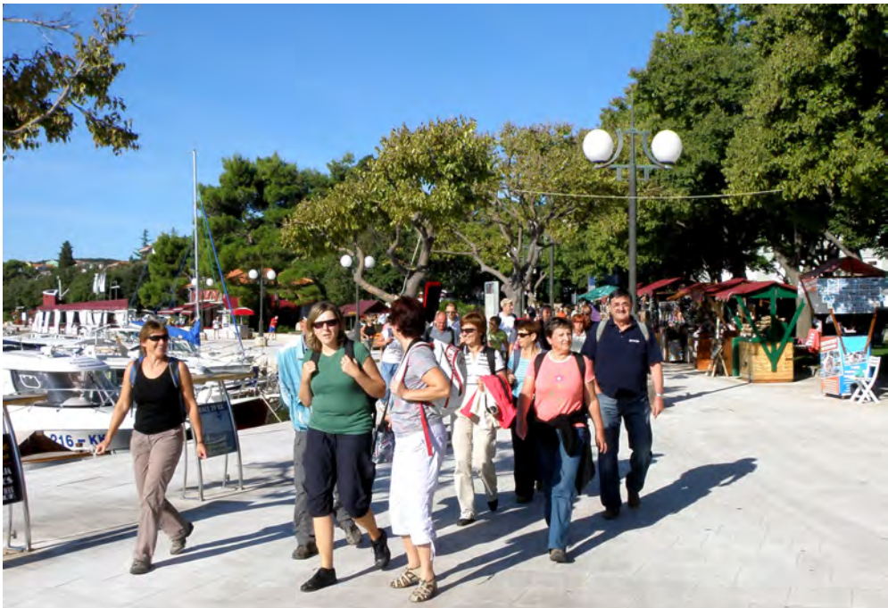
Slika 1: V mestu Krk

Tako kot na spomladanskem izletu je bila udeležba tudi tokrat številčna. Z Gorenjske smo se v zgodnjih jutranjih urah odpeljali proti Ljubljani in naprej proti hrvaški meji, nato na otok Krk, kjer nas je v mestu Krk čakala barka, ki nas bo odpeljala na Goli otok.