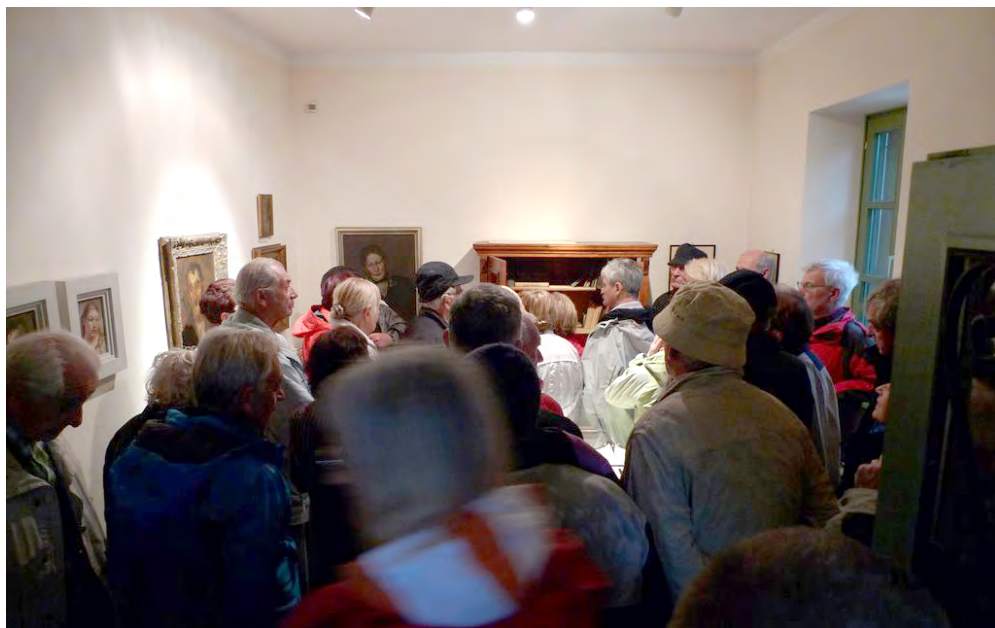
Slika 2: V Kosovelovi hiši

V Tomaju smo se ustavili kar na cesti in hitro skočili v Kosovelovo domačijo, kjer nas je pričakala prijetna gospa z bogato pripovedjo o Srečku Kosovelu in njegovih, ki jih je osebno poznala. Tako malo sem vedela o tem pesniku, saj je umrl zelo mlad, da sem bila res vesela predstavitve.