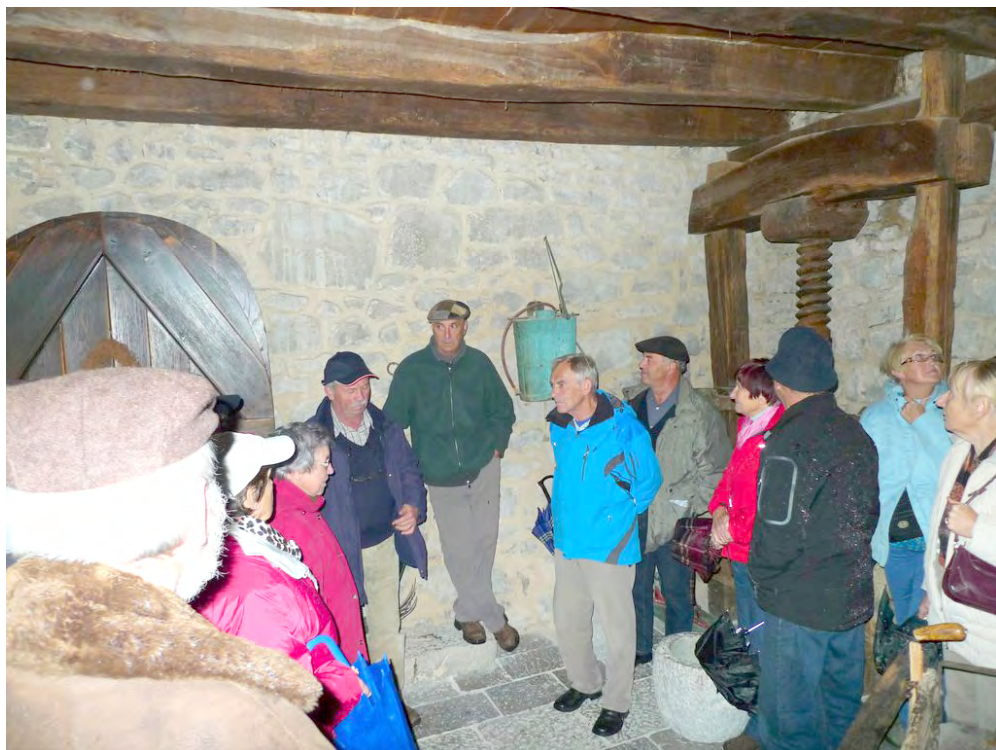
Slika 3: V štanjelski hiši

Pot smo nadaljevali do Štanjela. Kljub dežju smo se oboroženi z dežniki povzpeli na grad. Tam nas je pričakal vodnik, domačin iz Štanjela. Zelo izvirno, torej iz prve roke, nam je pripovedoval o nastanku naselja in tamkajšnjem življenju. Sedaj je v njem ostalo zelo malo ljudi, predvsem starejših. Kljub grmenju in dežju smo si ogledali kar tri objekte in okolico. Bilo pa je tudi precej hladno, saj je termometer kazal 2°C.