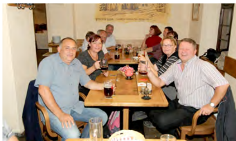
Slika 7: V pivnici je bilo veselo

Prehitro je prišel zadnji dan izleta, ki smo ga začeli z obiskom čudovitega svetovno znanega mesteca Češky Krumlov. Razkropili smo se po ozkih ulicah in umetniških trgovinicah za lepo vzdrževanimi starimi pročelji, opravili še zadnje nakupe ali pa si, v eni izmed mnogih kavarnic, privoščili kavo ob pogledu na vrvež množice turistov. Pot proti domu smo prekinili s postankom za ogled gradu Rožnberk, ki se z lepim renesančnim okrasjem na pročelju mogočno bohota na vzpetini nad Vltavo.