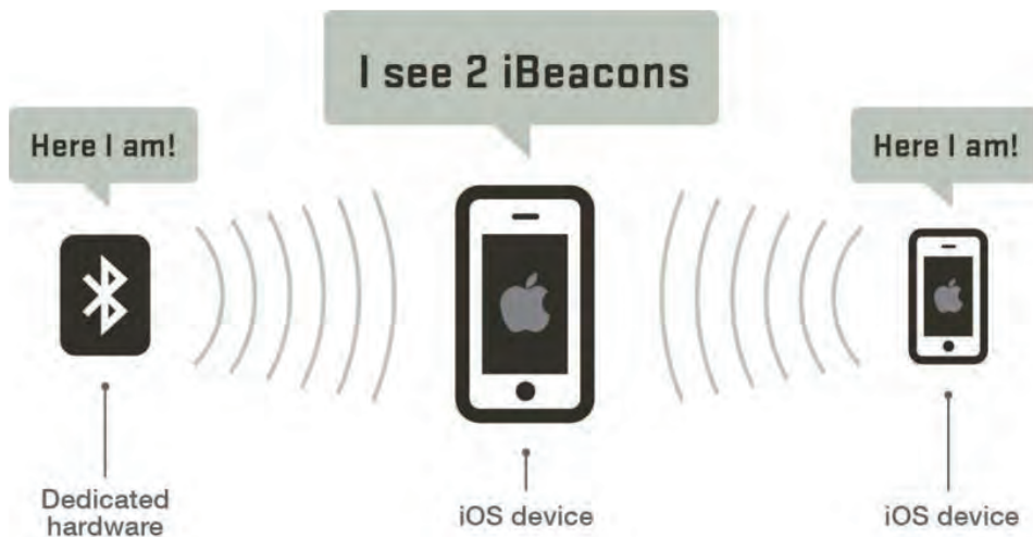
Slika 3: Delovanje standarda iBeacon (iBeaconInsider, 2015).

V literaturi se pogosto zamenjujeta izraza iBeacon in svetilnik (angl. beacon ). iBeacon je tehnološki standard podjetja Apple, ki dovoljuje mobilnim aplikacijam, delujočim na platformi iOS oziroma Android, iskanje signalov okoliških svetilnikov in oddajanje lastnih signalov. Oddajniki delujejo po že navedeni tehnologiji nizkoenergijski Bluetooth.