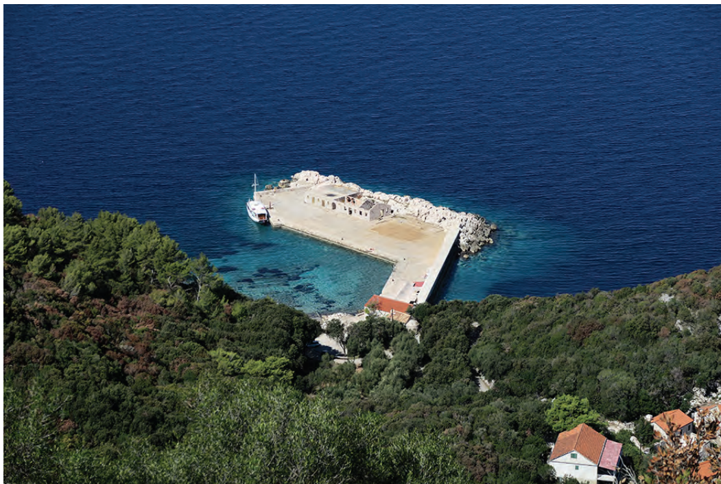
Slika 5: Čudoviti utrinek s pohoda.