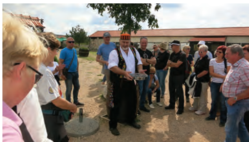
Slika 6: Etnografski utrinek s pohoda.