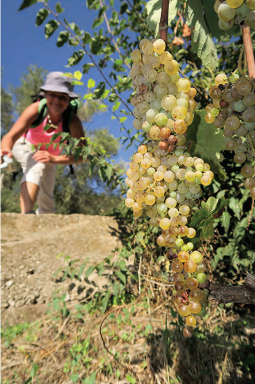
Slika 3: Sladki utrinek s pohoda.