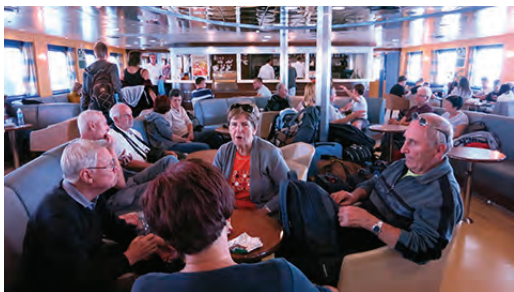
Slika 1: Utrinek s trajekta.

Kot vsako leto smo se tudi letos člani Ljubljanskega geodetskega društva odpravili na pohodniški planinski izlet na jadranski otok. Tokrat smo si za cilj izbrali Lastovo. Izlet je v nadaljevanju predstavljen z opisom dogajanja po dnevih in s fotografijami, ki govorijo več kot besede.