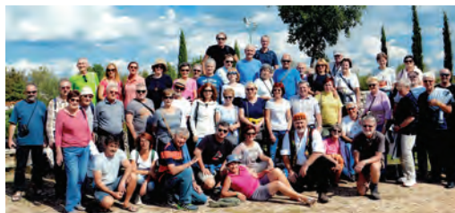
Slika 7: Prijateljski utrinek s pohoda.

Se vidimo naslednje leto na naslednjem jadranskem otoku!