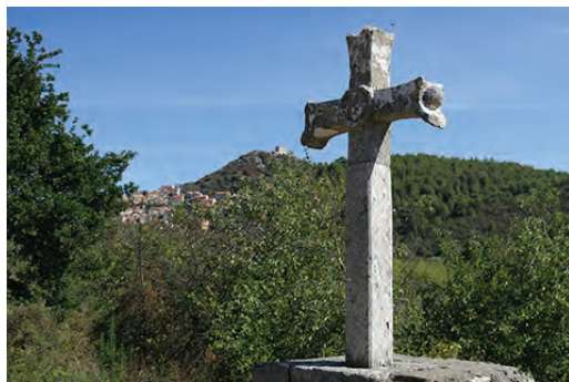
Slika 2: Duhovni utrinek s pohoda.