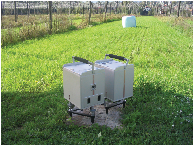
Slika 4: Primer stabilizacije gravimetrične točke Radmirje GT15 iz osnovne gravimetrične mreže.

Ostalih 18 relativnih gravimetričnih točk je stabiliziranih s kovinskimi čepi, ki so nameščeni v stopnišča ali podstavke starejših, masivnejših objektov, kot so cerkve ali spomeniki.