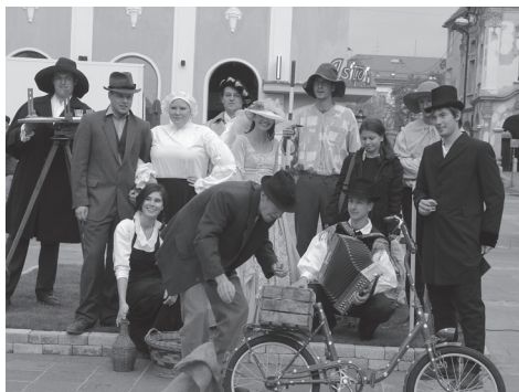
Slika 2: Študentje FGG – Oddelek za geodezijo, Grajski trg Maribor.

Brez poznavanja preteklosti ni sedanosti in ne razvoja, zato je naša generacija dolžna delček preteklosti ohraniti v obliki muzejske zbirke. Vse odgovorne prosimo, da poskrbijo za našo stalno zbirko v Bogenšperku, jo dopolnijo z eksponati, ki se še nahajajo po posameznih izpostavah, da tako ohranimo našo bogato tehnično dediščino.