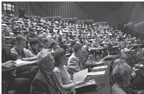
Slika 3: Udeleženci posveta so napolnili dvorano.

Geodeti se sicer ne hvalimo prav radi. Zaradi narave dela se verjetno za ta poklic odločamo sicer natančni, a bolj tihi ljudje, ki nimamo preveč radi javnega nastopanja. Pravzaprav smo geodeti običajno opazni šele, ko je z evidencami o prostoru kaj narobe, ko uporabniki ne dobijo pravega ali pa sploh nobenega podatka. Pa vendar smo sposobni, zmoremo in moramo zagotoviti ustrezno in enovito osnovo za reševanje problemov v tem našem skupnem in edinem prostoru. Tudi tokratna izvedba Geodetskih dni je pripomogla k uveljavljanju stroke in s tem se brez sramu lahko pohvalimo!