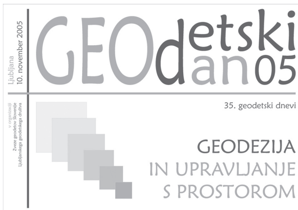
Slika 2: Logotip in znak strokovnega srečanja

Kongresni prostori poslovne stavbe GIO na Dunajski cesti 160 v Ljubljani so ponovno izkazali primernost za izvedbo tovrstnih prireditev in zagotovili ustrezno sodelovanje več kot 300 udeležencem strokovnega posveta, ki so zavzeto spremljali predstavitve in referente spontano nagradili z aplavzom.