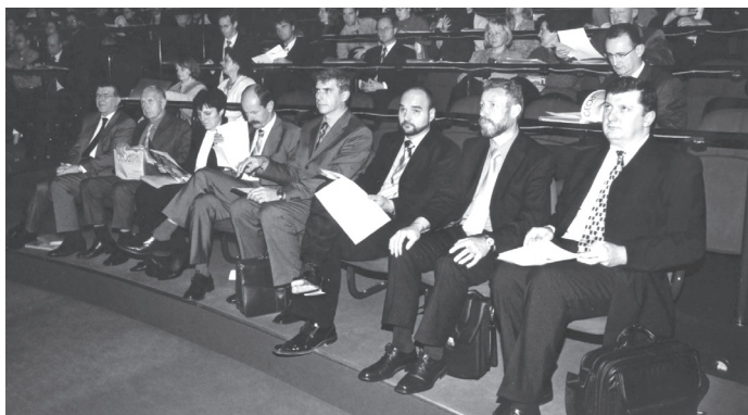
Slika 1: Gostje in govorniki 35. Geodetskih dni

Program strokovnega posveta je temeljil na aktualnem dogajanju in predstavitvah problematike s strani vabljenih referentov. Teme so bile dovolj široko zastavljene, da so vzbudile zanimanje predstavnikov različnih strok.