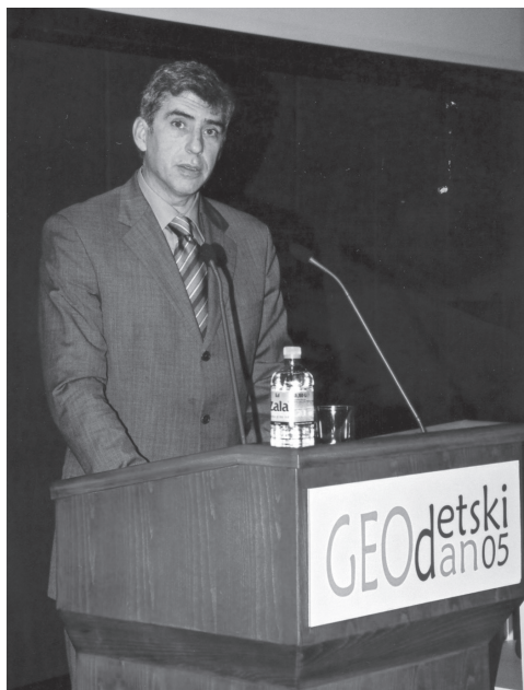
Slika 4: Predsednik ZGS za govorniškim odrom.

Na koncu pa mi dovolite, da zapišem še nekaj misli v smislu (pod)naslova iz prvega odstavka tega poročila, saj ima uspešna izvedba tokratnega jubilejnega posveta kar nekaj temnih plati! O konceptu Geodetskih dni je razprava na ravni Zveze geodetov Slovenije potekala kar nekaj let, a očitno pravega konsenza še vedno ni.