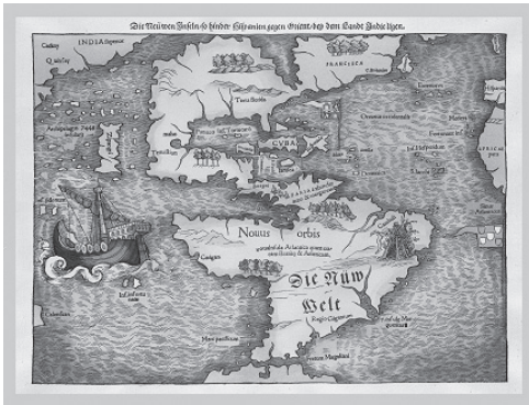
Slika 1: Novi Svet ( Die nūw Welt ), Sebastian Münster, original iz leta 1538.