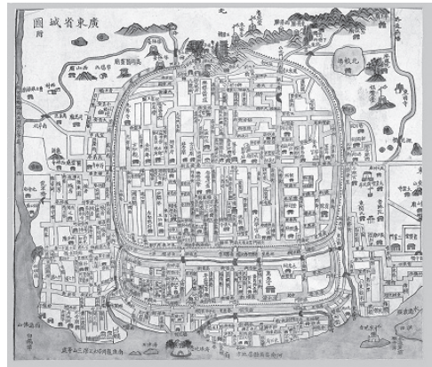
Slika 2: Na mestni karti Kantona na Kitajskem je izrisana pregledna podoba območja mesta. Karta je bila izdelana med letoma 1818–1830