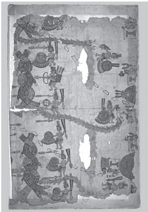
Slika 4: Codex Huamantla. Del devetdelnega dokumenta iz Huamantle blizu kraja Tlaxcala, Mehika. Celoten dokument je originalno dolg 7 metrov in širok 2 metra. Ostali deli so v Mehiki. Vsebina je kartografsko zgodovinska, v prevladujočem indijanskem stilu iz zgodnje kolonialne dobe. Codex so verjetno izdelali Otomi Indijanci.