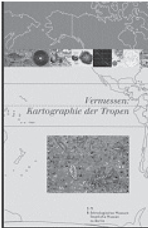
Slika 5: Knjiga Viole König v nemškem jeziku kot spremna knjiga razstave ima 112 strani s 85 (večinoma barvnimi) slikami.