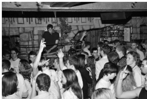
Slika 13: Zabava z DJ-em ...