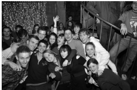
Slika 14: ... se je nadaljevala ...