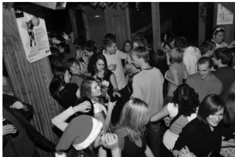
Slika 15: ... vse do jutranjih ur.

Geodeti smo se povezali in navezali nove stike, pa tudi »bruci« se bodo na fakulteti počutili bolj domače. Za njimi je že prvo izpitno obdobje in prepričani smo, da je bilo uspešno. Letošnje spremembe in novosti pa so vsi lepo sprejeli.