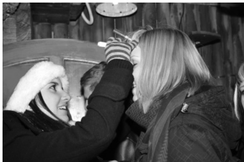
Slika 3: ... jim napisala oznako B ...