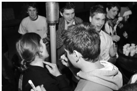
Slika 4: ... tistim bolj upornim pa so to naredili fantje.

Med pripravami na brucovanje smo naleteli na veliko težavo. Stara, nam dobro znana, lokacija Pri Jovotu žal ni bila primerna, zato smo začeli razmišljati o novi. Po napornem preiskovanju Ljubljane smo se odločili za Bolivar Cafe na Dolenjski cesti, nad znanim streliščem. Seveda smo