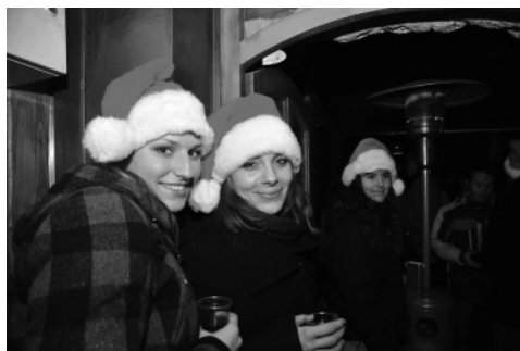
Slika 2: Na vhodu so »bruce« sprejela naša dekleta ...