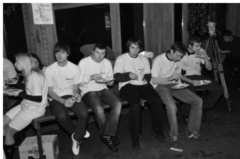
Slika 5: Najprej večerja

zaradi novega prostora uvedli nekaj novosti. Za hrano je poskrbel »Jovo«, tokrat v obliki ruskega bifeja. Veliko smo plesali, saj se je DJ izkazal in je vrtil glasbo vse do jutranjih ur. Brucovanje (oglaševali smo ustno, razobešali plakate, predstavili skupino na Facebooku in drugih študentskih spletnih straneh) je uspelo, saj se ga je po našem udeležilo okoli 270 ljudi. No, pa pustimo dejstva in preidimo na prireditev.