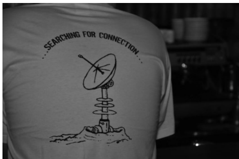
Slika 1: Naslov in logotip brucovanja na majici

Kot že v preteklosti smo se tudi letos študentje zaključnih letnikov geodezije, univerzitetnega in visokošolskega študija, potrudili in pripravili sprejem za novopečene geodete – »bruce«. Geodetsko brucovanje, katerega tema se je glasila »... Searching for connection ...«, smo izpeljali decembra 2009. Seveda smo povabili tako bruce kot vse študente geodezije, profesorje in asistente ter druge goste geodetske stroke.