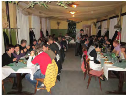
Slika 5 in 6: Slovenski večer ob zvokih narodne glasbe in slovenskih dobrotah

V soboto nas je pot popeljala iz meglene Ljubljane proti Obali, kjer so nas že na postojnskih vratih pozdravili topli jesenski žarki. Ogledali smo si Sečoveljske soline in spoznali krajinski park solin, območje habitatov redkih, ogroženih in značilnih rastlinskih in živalskih vrst, na katerem je zaradi dolgotrajnega delovanja človeka nastal tipičen solinski ekosistem.