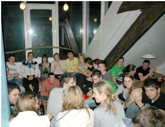
Slika 9 in 10: Podelitev diplom ob zaključku

Vsi se že veselimo ponovnega snidenja prihodnje leto v Zagrebu. Upamo, da bodo postala takšna srečanja študentov geodezije iz nekdanje skupne države tradicionalna, saj bogatijo naše študentsko življenje.