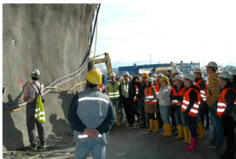
Slika 7: Obisk predora Markovec

Ogledali smo si gradnjo avtocestnega predora Markovec, ki bo povezoval Izolo in Koper, ter vlogo in delo geodetov pri njej. Preostanek sončnega dne pa smo preživeli v prijaznem okolju starega obmorskega mesteca Piran.