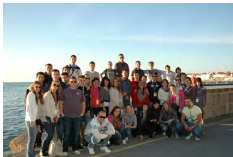
Slika 8: Skupinska slika v Piranu

Takšna in podobna srečanja so pomembna, saj utrjujejo in ustvarjajo prijateljske vezi ter dokazujejo, da se znamo povezovati, družiti in si izmenjavati izkušnje ne glede na jezikovno in narodno pripadnost.