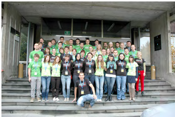
Slika 3: Skupinska slika udeležencev RGSM Ljubljana 2011 pred Geodetsko upravo Republike Slovenije

Obiskali smo tudi sedež Geodetske uprave Republike Slovenije, kjer so nam predstavili svojo osnovno organizacijsko strukturo, področja dela in aktualne projekte. Največ zanimanja so vzbudili prostorski portal Prostor, njegova prosta dostopnost in količina podatkov, ki so na voljo slehernemu uporabniku.