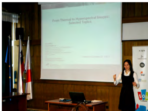
Slika 2: Strokovna predstavitev

V strokovnem delu so bile predstavljene različne geodetske teme - od aktualnih projektov, raziskovalnih in diplomskih del do najnovejše tehnologije na področju geodetskih instrumentov. Predstavljeni sta bili raziskavi »Razvoj postopkov obdelave opazovanj GNSS za navigacijo oseb v oteženih pogojih« in »Analiza tehnologije terestičnega laserskega skeniranja za spremljanje deformacij na objektih« ter diplomsko delo z naslovom »Določitev polinomske enačbe za naravno Zemljino projekcijo«. Spoznali smo tudi zadnje dosežke na področju razvoja geodetskih instrumentov, predstavitev slikovne podpore pri merjenju v geodeziji in pridobili kratek vpogled v