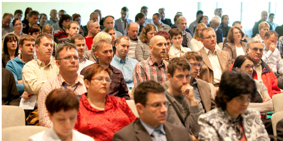
Slika 13: Udeleženci konference