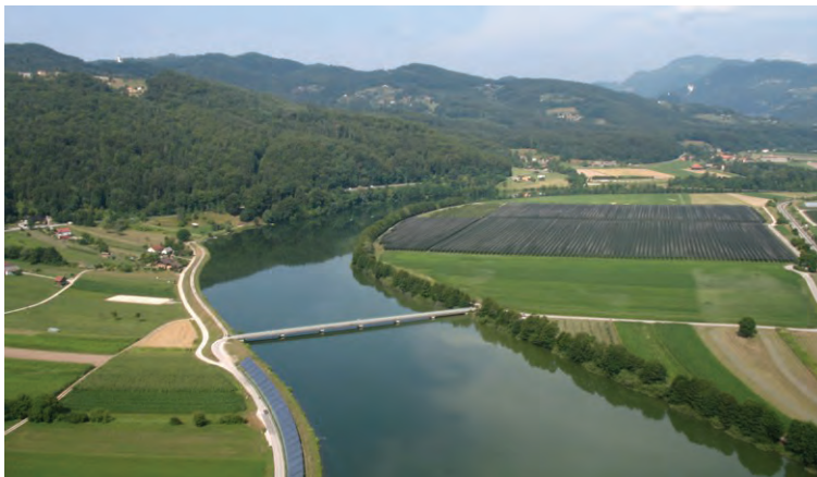
Slika 1: Večfunkcionalnost podeželskega prostora, Posavje.