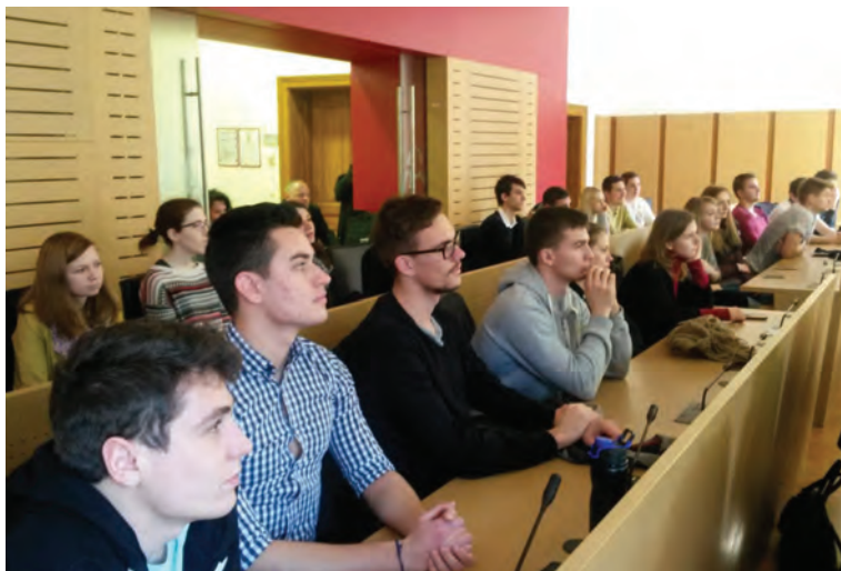
Slika 2: Sedeže novomeških občinskih svetnikov smo zasedli študenti geodezije.