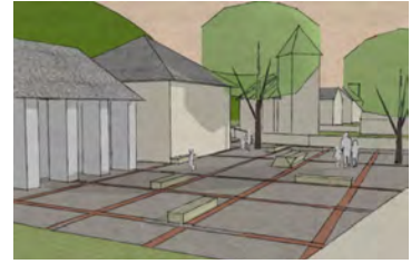
Slika 5: Ureditev vaškega jedra (avtorji: I. Marković, A. Oršiček, L. Ovčarić, M. Parlov, Iva Š., D. Klepej, S. Vrničar).

Razpršeni hotel je ena izmed oblik turistične ponudbe, ki jo je mogoče vzpostaviti na Koprivniku in v drugih naseljih na Pokljuki (slika 6), saj povezuje manjše turistične ponudnike v skupno zagotavljanje turističnih storitev. Prenočitvene zmogljivosti se lahko uredijo v zapuščenih kmetijskih objektih, ki se ustrezno prenovijo v skladu z Zakonom o Triglavskem narodnem parku. Vsaka enota hotela (recepcija, restavracija, sobe, odprte kmetije itd.) se vzpostavi v drugem, sedaj zapuščenem objektu.