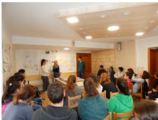
Slika 2: Maketa razpršenega naselja Koprivnik (levo) in predstavitev rezultatov delavnice (desno)

Po koncu tridnevne delavnice smo delo nadaljevali in izpopolnjevali. V maju 2016 smo izvedli telekonferenco ter s predstavniki krajevne skupnosti, TNP in TVKD Kranj obravnavali izpopolnjene rešitve, nato pa jih 1. 7. 2016 na Koprivniku spet javno predstavili krajanom in zainteresirani javnosti. Rezultate smo predstavili tudi v publikaciji in pripravili manjšo razstavo v gasilskem domu na Koprivniku, da so si predlagane rešitve lahko ogledali tudi tisti, ki niso prišli na javno predstavitev.