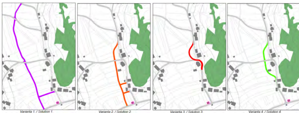
Slika 3: Variantne rešitve poteka nove ceste (avtorice: M. Benković, A. Finek, D. Jelavić, K. Hubeny, M. Jordan, M. Mauko).

v nasprotju s prejšnjo, zaščiti lipa, ne ponuja pa rešitve za varno pot do avtobusne postaje, ki leži na južnem obrobju naselja. Ob povezavi vseh meril za načrtovanje nove trase in trga so krajani v večini podprli varianto 2.