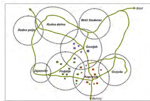
Slika 6: Koncept razpršenega hotela, ki povezuje naselja na Pokljuki (avtorice: M. Amorim, M. Jezernik, A. Kafol, A. Potočnik).

Razpršeni hotel je ena izmed oblik turistične ponudbe, ki jo je mogoče vzpostaviti na Koprivniku in v drugih naseljih na Pokljuki (slika 6), saj povezuje manjše turistične ponudnike v skupno zagotavljanje turističnih storitev. Prenočitvene zmogljivosti se lahko uredijo v zapuščenih kmetijskih objektih, ki se ustrezno prenovijo v skladu z Zakonom o Triglavskem narodnem parku. Vsaka enota hotela (recepcija, restavracija, sobe, odprte kmetije itd.) se vzpostavi v drugem, sedaj zapuščenem objektu.