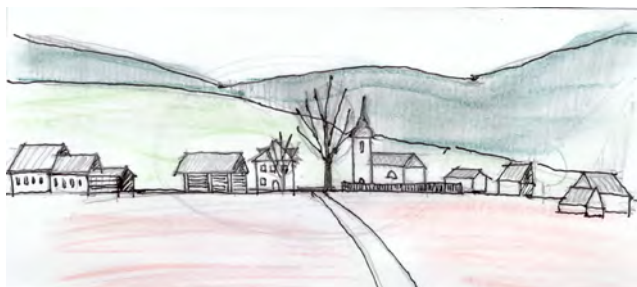
Slika 1: Naselje Koprivnik (levo) in skica ožjega vaškega jedra ob cerkvi (desno) (foto: A. Kafol, 2016, avtorica skice: S. Vraničar).

V začetni fazi priprav na terensko delo smo analizirali ožje in širše območje Koprivnika ter pripravili ustrezna gradiva in maketo (slika 2) za izvedbo terenskega dela. Udeležili smo se dveh celodnevih ekskurziji s predavanji. Prva je bila v Ljubljani na Fakulteti za gradbeništvo in geodezijo, kjer so nas obiskali kolegi arhitekti iz Zagreba. Seznanili smo se s turizmom na zavarovanih območjih in tipologijo naselij v slovenskem ruralnem prostoru, s poudarkom na alpskem prostoru. Druga je bila ekskurzija v Zagreb, kjer so nas na Fakulteti za arhitekturo seznanili s hrvaškimi zavarovanimi območji (nacionalni park Severni Velebit, nacionalni park Plitviška jezera) in tamkajšnjim turizmom.