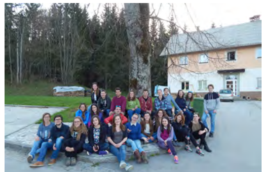
Slika 7: Sklepna razstava o delavnici (levo) in sodelujoči na delavnici (desno) (avtorja: A. Potočnik, G. Mrak).