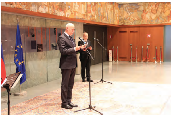
Slika 1: Slavnostni govornik dr. Milan Brglez, predsednik državnega zbora.