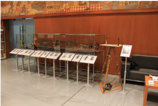
Slika 5: Utrinek z razstave: arhivska zbirka geodetskih instrumentov.