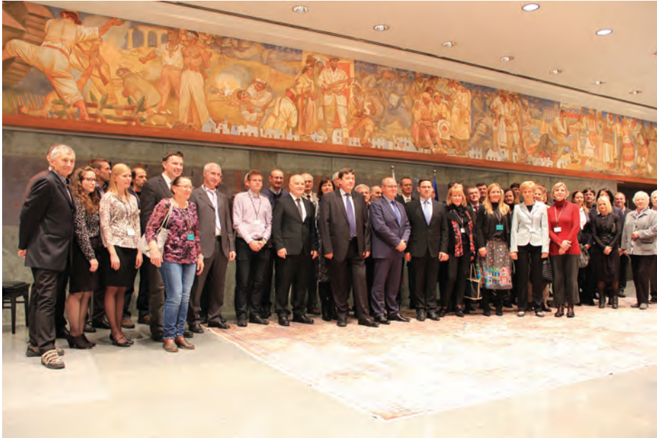
Slika 4: Obiskovalci odprtja razstave.