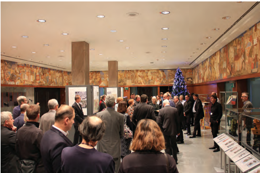
Slika 3: Odprtja razstave so se udeležili številni gostje iz geodetske stroke in političnih krogov.