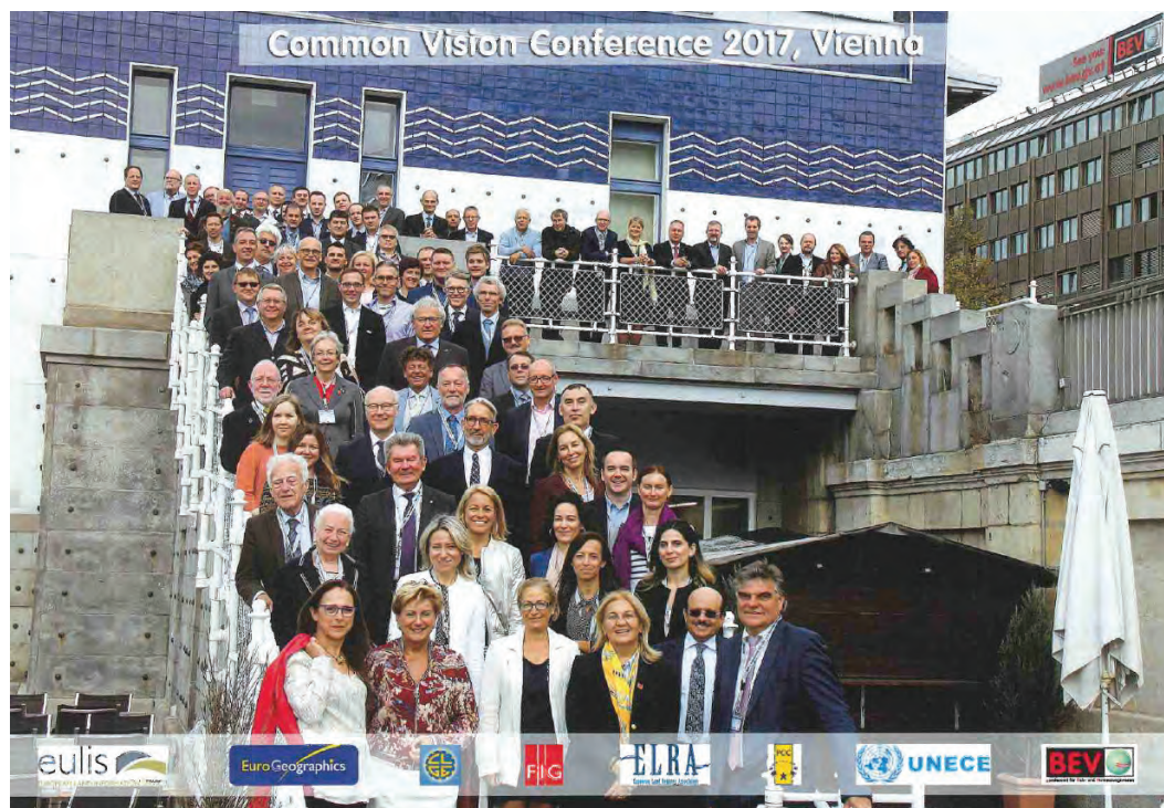
Slika 2: Udeleženci mednarodne konference o viziji razvoja katastra nepremičnin Common vision.