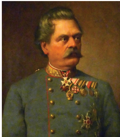
Slika 2: Franc Kuhn baron Kuhnenfeld.

Utemeljitev komisije za poimenovanja in evidentiranja naselij, ulic in stavb v mestni občini Ljubljana za preimenovanje ulice v Zemljemersko je seveda slonela na tem, da sta imeli takrat na njej sedež dve pomembni geodetski inštituciji, in sicer Geodetska uprava Republike Slovenije ter Geodetski zavod Slovenije – oba na naslovu Zemljemerska ulica 12 (slika 3). Slednjega žal ni več.