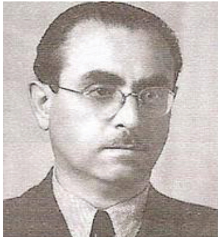
Slika 4: Profesor Ivan Čuček.

Na koncu brošure je predstavljen profesor Ivan Čuček (slika 4) – edini geodet, po katerem je poimenovana kakšna ljubljanska ulica. Čučkova ulica stoji na območju cestnega razcepa Kozarje in pod pravim kotom seka Tržaško cesto. Čuček je bil redni profesor fotogrametrije na geodetskem oddelku takratne Tehniške fakultete v Ljubljani. V letih 1960–1961 je bil dekan Fakultete za gradbeništvo in geodezijo. Zaslužen je za ustanovitev Inštituta za geodezijo in fotogrametrijo in je bil tudi njegov dolgoletni direktor. Leta 1989 je postal zaslužni profesor Univerze v Ljubljani.