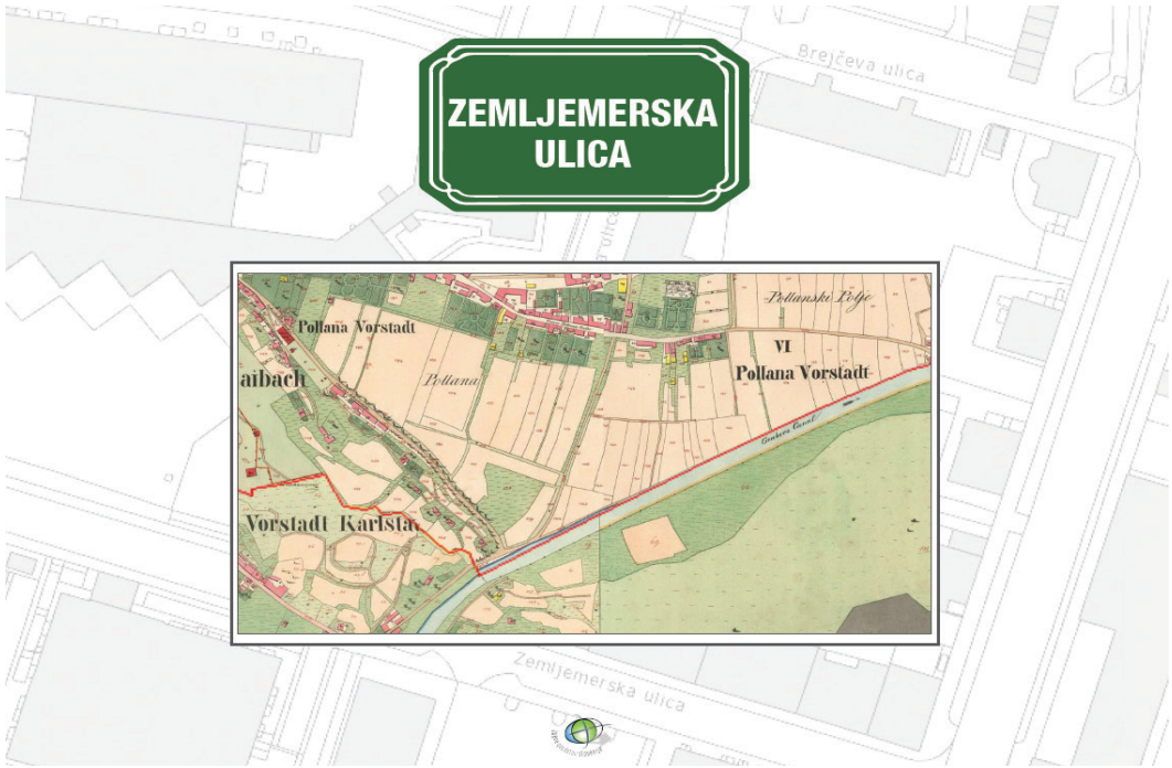
Slika 1: Naslovnica brošure Zemljemerska ulica.