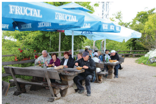
Sliki 1 in 2: Utrinka s Krima.