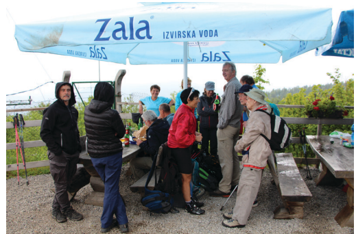
Sliki 3 in 4: Udeleženci med živahnim klepetom.

Novе aktivnosti so pred nami, člane pozivamo, da spremljajo obvestila na spletni strani društva in poštna sporočila, s katerimi društvo tradicionalno zanesljivo obvešča o novostih. Kmalu nasvidenje!