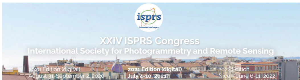
Slika 2: Najava mednarodnega kongresa ISPRS, ki je bil iz leta 2020 prestavljen v leto 2022.

Dodatno velja povabilo k sodelovanju študentom in mlajši generaciji strokovnjakov, ki se lahko vključite v mednarodno mrežo mladih strokovnjakov v okviru zveze FIG – Young Surveyors ( https://www.fig.net/organisation/networks/ys ) in združenja ISPRS – Student Conortium ( http://sc.isprs.org/home.html ).