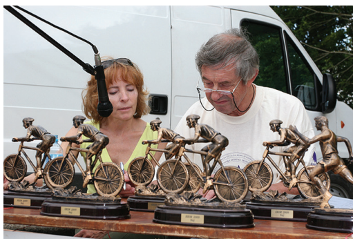
Slika 4: Utrinek s Krima.