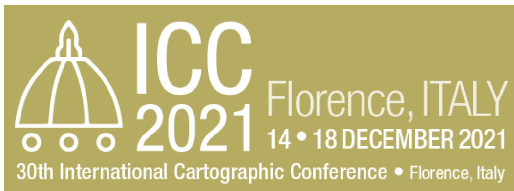
Slika 3: Logotip mednarodne kartografske konference 2021 Firenze.

Mednarodno kartografsko združenje, ki vključuje več kot trideset komisij, redno organizira regionalne konference ter bienalno svetovne kartografske konference. Sodelovanje slovenskih kartografov je bilo zadnja desetletja precej skopo, čeprav še vedno vodimo komisijo za planinsko kartografijo in se na konferencah redno pojavljamo s strokovnimi in znanstvenimi prispevki. Aktivnosti so se sicer v zadnjih mesecih izvajale pretežno na daljavo. Se pa letos kljub še zelo negotovim razmeram širši slovenski geodetski in kartografski stroki ponuja možnost za dejavnejšo vključitev, saj bo svetovna kartografska konferenca potekala v bližnjih Firencah ( https://www.icc2021.net/ ). Termin izvedbe je bil sicer v upanju na možnost sprostitve razmer in fizične prisotnosti udeležencev iz prvotno predvidenega poletja prestavljen v drugo polovico decembra. Zaradi bližine in, vsaj upajmo, nižjih stroškov udeležbe in potovanja bo konferenca lepa priložnost za vse, ki se v Sloveniji ukvarjamo s kartografijo, da predstavimo svoje izdelke, ostanemo v toku z novostmi in navežemo nove stike. Poleg sodelovanja z znanstvenimi in strokovnimi prispevki ponovno predvidevamo sodelovanje na mednarodni razstavi kart ter razstavi otroških risb, h kateremu bomo vse, ki ste sodelovali ali pokazali interes za to v prejšnjih letih, posebej povabili.