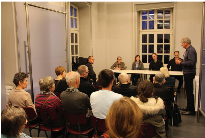
Slika 6: Utrinek z občnega zbora LGD v februarju 2020.

druženja večjega števila oseb pa tudi v bližnji prihodnosti ni bila verjetna, in tako sklic občnega zbora društva v donedavno običajni obliki ni bil mogoč. Izvršni odbor društva je, v skrbi za zdravje članov in tudi na podlagi izkušenj z organizacijo 48. Geodetskega dneva, ki je navkljub večinoma spletnemu sodelovanju udeležencev požel velik odziv in vrsto priznanj, sklenil občni zbor izvesti v predpisanem roku za sprejem letnega poročila o poslovanju, a brezstično, na daljavo, z uporabo spletne platforme Zoom.