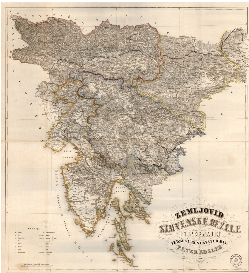
Slika 1: Kozlerjev Zemljevid slovenske dežele in pokrajin, izdelan leta 1825, natisnjen leta 1853 in izdan leta 1861 (prva izdaja). Izvorno merilo zemljevida je 1 : 576.000. Zemljevid je bil za takratni čas in družbenopolitične razmere izjemnega znanstvenega, kartografskega in narodnoubuditeljskega pomena.

Pred dvesto leti se je 16. februarja rodil Peter Kozler, ki se je v slovensko zgodovino odmevno zapisal predvsem kot avtor slovitega Zemljevida slovenske dežele in pokrajin (slika 1) in kot soustanovitelj Pivovarne Kosler, predhodnice kasnejše Pivovarne Union.